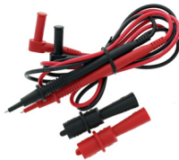
TL-757 Cordons de mesure