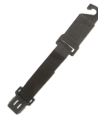
UMHS-757 Sangle de suspension magnétique universelle