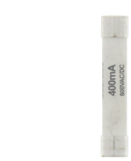
F-10A-337 Fusible pour 61-337