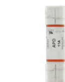
F-11A-347357 Fusible pour 61-357 & 61-347