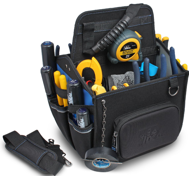
37-030 Porte-outils de première qualité à fond moulé (Produits non inclus)