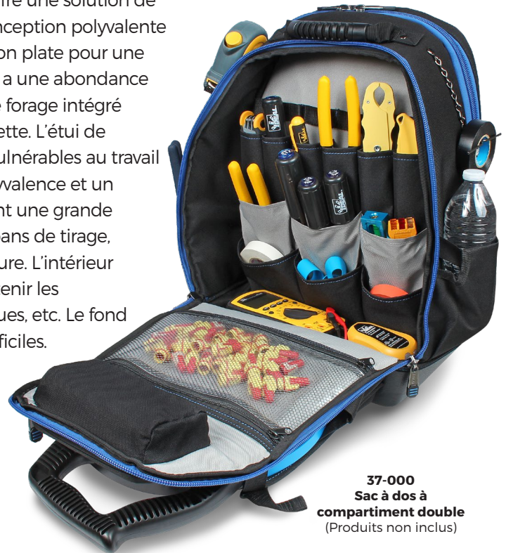
37-000 Sac à dos à compartiment double (Produits non inclus)

37-001 14-1 / 2 pouces x 18-1 / 2 pouces x 9 pouces