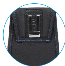
Clip de ceinture