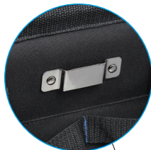
Clip pour ruban à mesurer