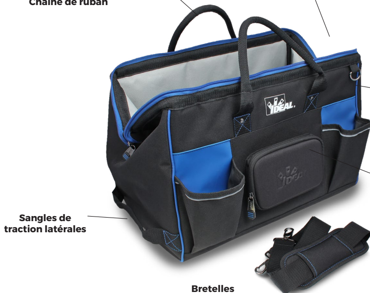
Sangles de traction latérales