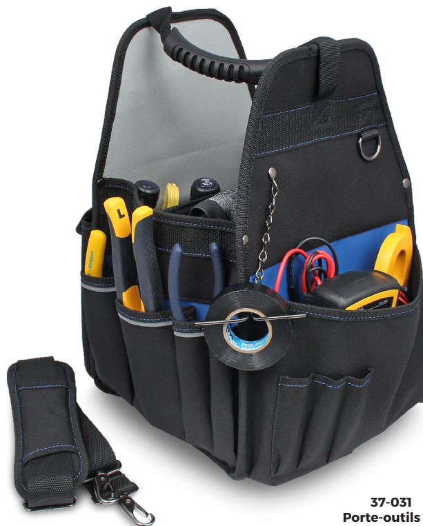
37-031 Porte-outils de première qualité (Produits non inclus)