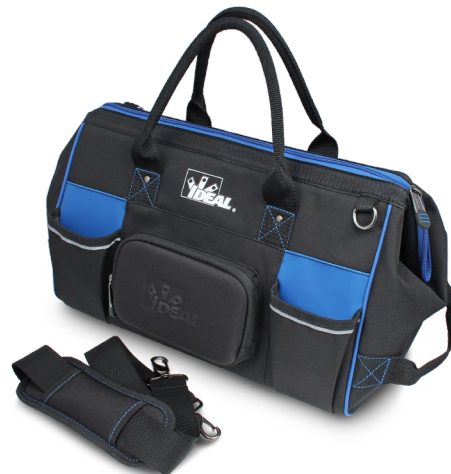
Parois latérales renforcées