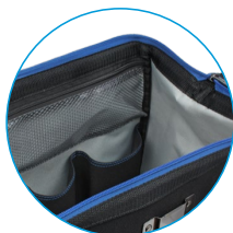
Parois latérales renforcées