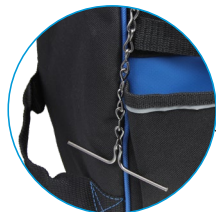
Chaîne de ruban