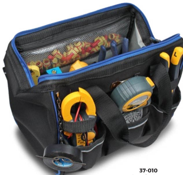
37-010 Sac à outils à grande ouverture 13 po (Produits non inclus)