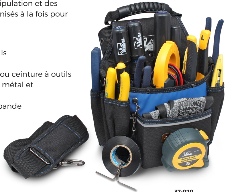
37-020 Pochette d'outils à première qualité (Produits non inclus)