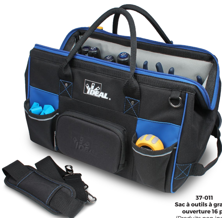
37-011 Sac à outils à grande ouverture 16 po (Produits non inclus)