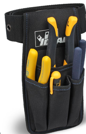
(Produits non inclus)