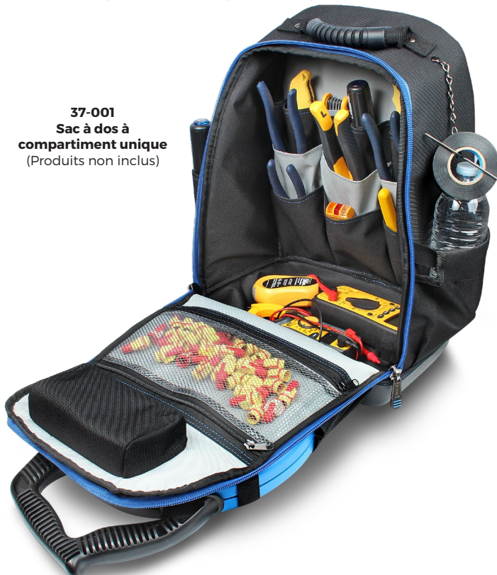
37-001 Sac à dos à compartiment unique (Produits non inclus)

Le sac à dos à outil à compartiment unique IDEAL® Série pro a un design compact et léger offrant une solution pour toute personne de métier. Il contient plusieurs poches à plusieurs niveaux conçues pour accéder facilement aux outils et à l'équipement dont vous avez le plus besoin et les organiser. Équipé d'un étui de protection pour téléphones et lunettes de soleil, d'un fond moulé durable, d'une poche en ruban de tirage, d'une chaîne à ruban adhésif et d'un clip pour ruban de mesure, ce paquet a tout le nécessaire pour gérer et transporter facilement vos outils entre les chantiers confortablement.