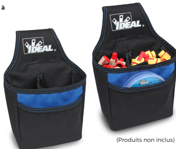
(Produits non inclus)