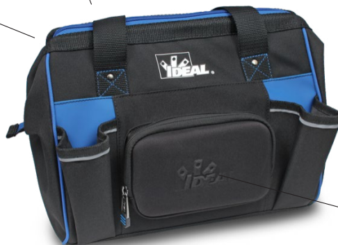
Étui téléphone / lunettes de soleil