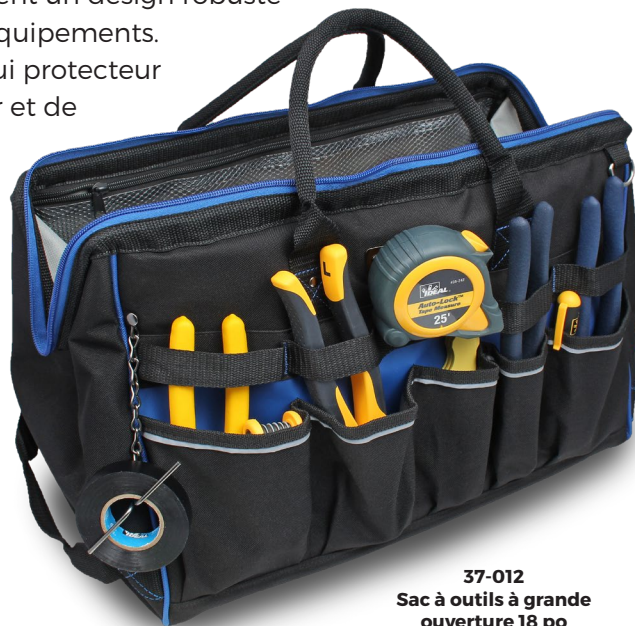
37-012 Sac à outils à grande ouverture 18 po (Produits non inclus)